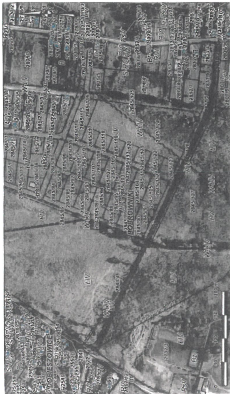
Położenie i przebieg drogi gminnej, obręb Bobrowniki, gm. Bobrowniki